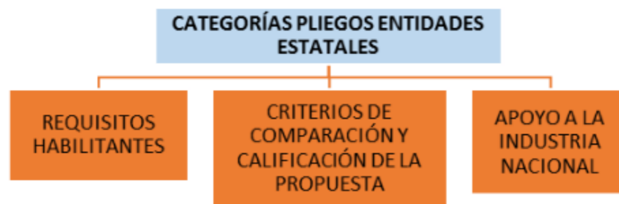
Figura 2 Categorías identificadas Pliegos de condiciones colombianos