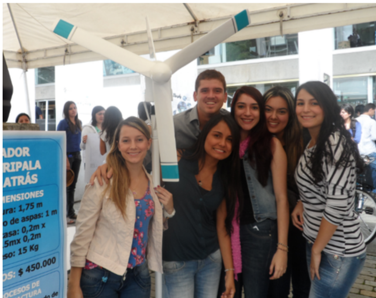
Figura 1 Expo ingenierías Universidad EAFIT

De esta manera se redactó el acta del proyecto que tenía como alcance: Lograr la construcción de una máquina funcional con los materiales idóneos. Una vez finalizada esta fabricación estas máquinas servirían como insumo para el laboratorio de máquinas de la Universidad EAFIT, para uso de los mismos estudiantes.